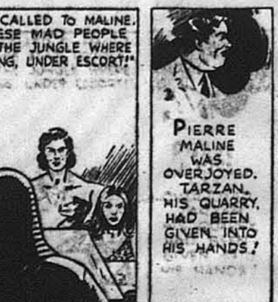
Потім він покликєв Малїна: „Забери дїх божевільних людей назад до джунглїв, де вони належать, під ескортоєм“. Пїєр Малїн був дуже радий: Тарзан був у його руках.