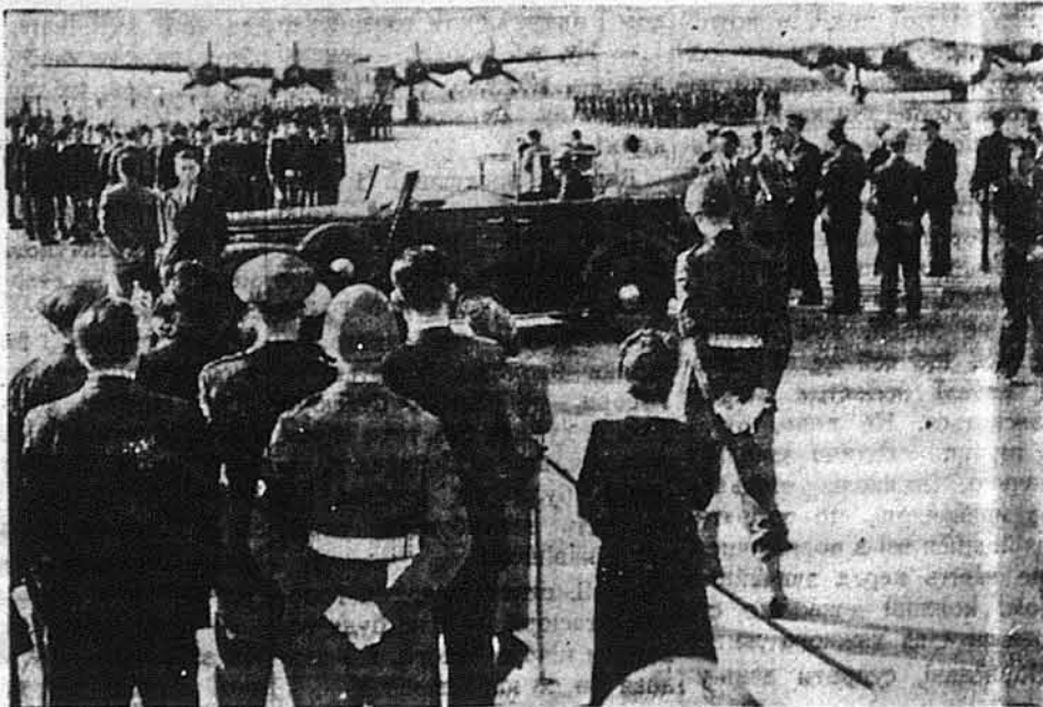
ЮГОСЛАВСЬКИЙ ВІДДІЛ. — Президент Рузвелт (сидить в авті) приглядається до реченню югославським боевим заголом чотирьох бомбовиків. Церемонія відбулася на Волинг Філд, у Вашингтоні.

Зо Швайцарії приходять вісті, що німці спроваджують до Франції війська, спеціально вишколені для боротьби з партизанами в Росії, задумуючи вжити їх проти французьких партизанів у Савої й Високій Савої. Фармерам у цих провінціях дано остерогу, аби були готовими покинути дім по 24-годинній заповідженню, бо мовляв фермерські доми будуться розбивати, аби не давати захисту повстанцям.