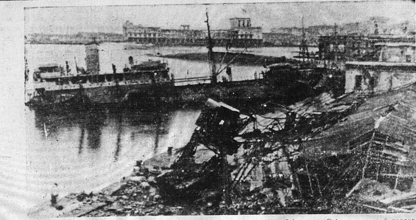
НЕАПОЛЬ ПО ВІДСТУПЛЕННЮ НАШТІВ. — Так представлялися кораблі держав Осі та причали й портови магазини в Неаполі по відступленню німців. Видно, знищили все, що могло придатися Аліантам.

редтим, нім її програє, то партизанська ідея саботажувати воєнні змагання держав Осі, могла мати на Мадярщині підхожий ґрунт. Мадярський уряд знає проти-воєнні настрої свого населення в притикаючих до Югославії районах і, щоби запобігти поширюванню там партизанського руху, уряд проголосив там воєнний стан. Не вільно виходити вночі на вулицю, не вільно відбувати громадських зібрань, і не можна згадувати про війну. Уряд подвоїв там жандармерію і дав їй право арештувати кожного підозрюемого чоловіка. Як хто покажеться вночі на вулицю, то жандармерія має право його арештувати і питати чи має дозвіл. Як нема, то його негайно ведуть на воєнний суд. БУТИ ЧЛЕНОМ УКРАЇНСЬКОГО НАРОДНОГО СОЮЗУ ЗНАЧИТЬ, НАЛЕЖАТИ ДО ТАКОЇ ЗАПОМОГОВОЇ ОРГАНІЗАЦІЇ, ЩО ПОВУДОВАНА НА ПЕВНИХ, ТРІВКИХ І СОЛІДНИХ ОСНОВАХ.