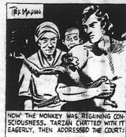
Тепер малпа почала відзискувати притомність. Тарзан заговорив з нею, а потім сказав до судді: