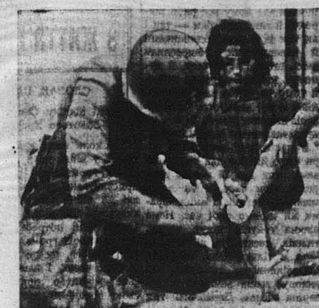
ПЕРША ПОМІЧ. —Військовий капелян полк. Вільєм Кінг з Канзас Сіті, Мєзурє, задержався на хвилину в Еболі, в Італії, аби дати першу поміч малій італїянці, котра скалічила собі ногу на оскалку. Священник живив при тому свого комісового пакуночка першої помічі, який має кожний воєк.