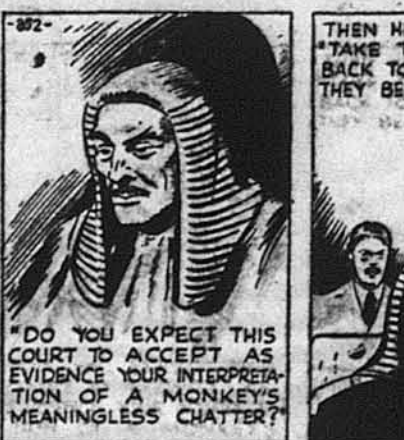
„Чи ти думаєш, що суд можє прийняти як свідчення твій переклад незрозумілої балачки малпи?“