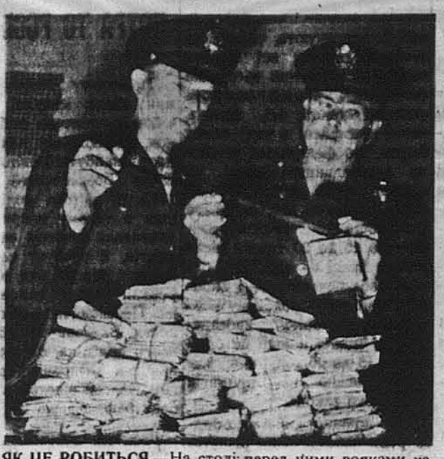
ЯК ЦЕ РОБИТЬСЯ. — На столі перед цими вояками наводиться 1,800 листів, на фільмовій тасемці в руках вояків знаходиться фотографія теж 1,800 листів. Ось чому для пересилки листів поза море вживається цього способу пересилки листів. Однаке листи для такої пересилки повинні бути написані на спеціальних „Вімейлу сервісмен”, бо такі письма мають першенство.

З торбинки визирає зложене хусточка. — Взяти? — Певно! Івась тручає Максимця раменем на жінку. Максимцьов сварить на публіку: „Спокій, товариші, не тисніться так!” Жінка сіпле словами наче горохом із мішка й кидая на старшину очима. „Грізне! Страшенно! Який це тятар!” Шукає хусточки. „Ах! Деж я її поділа?” Микольцо засунув червоноармійську шапку по завадіячки на вухо та кричить: — А гей, товариші! На Галерію! (З російської мови переклав М. Н-ий). (Кінець).