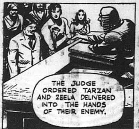
Судья приказав віддати Тарзана й Зулі в руки їх ворогів.