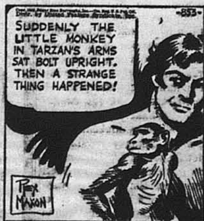
Нагло малпочка в Тарзанових руках сіла просто, а потім сталася дивна річ.