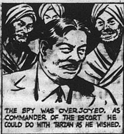
Шпигун був радий. Як командант ескорти він міг зробити з Тарзаном, що йому хотілося.