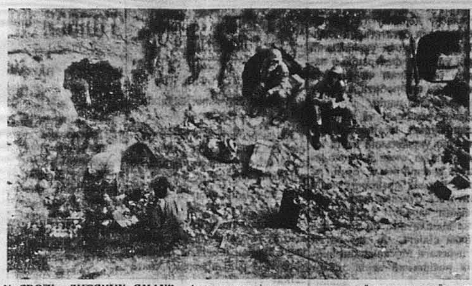
У СВОЇХ „ЛІСЯЧИХ ЯМАХ“.—Американські парашутисти вийшли з своїх „ліссячих ям“, аби погрітись. Вони заняли позиції на провалі Кіюнді, в Італії, і держали його проти поважних сил ворога, поки не підійшли альянтські війська.

ЖАРТИ Тайна зброя. Знаний німецький науковець з кінця 19. століття, професор Рудольф Вірхано, був гострим критиком канцлера Бісмарка за його вискоки та неспосібність поладнати деякі політичні справи. Раз він так допик Бісмаркови, що той же визвав професора на двобій. Професор Вірхано прийняв вивоз і приготував своїх секундантів. Коли вже все було готове і Бісмаркови секунданти прийшли умовитися за вибір зброї до двобою, професор переказав через своїх секундантів: „Як визваний, я маю право вибору зброї. Оце пославю противникови дві кобаси, одна подібна до другої як дві каплі води. Однак одна затроена смертельними бацилями трихози, а друга є чиста, без ніякої отруї. Його Ексцелленція, пан Канцлер, нехай вибирає, яка йому любя. Я тоді візьму другу“. Двобій відкликано.