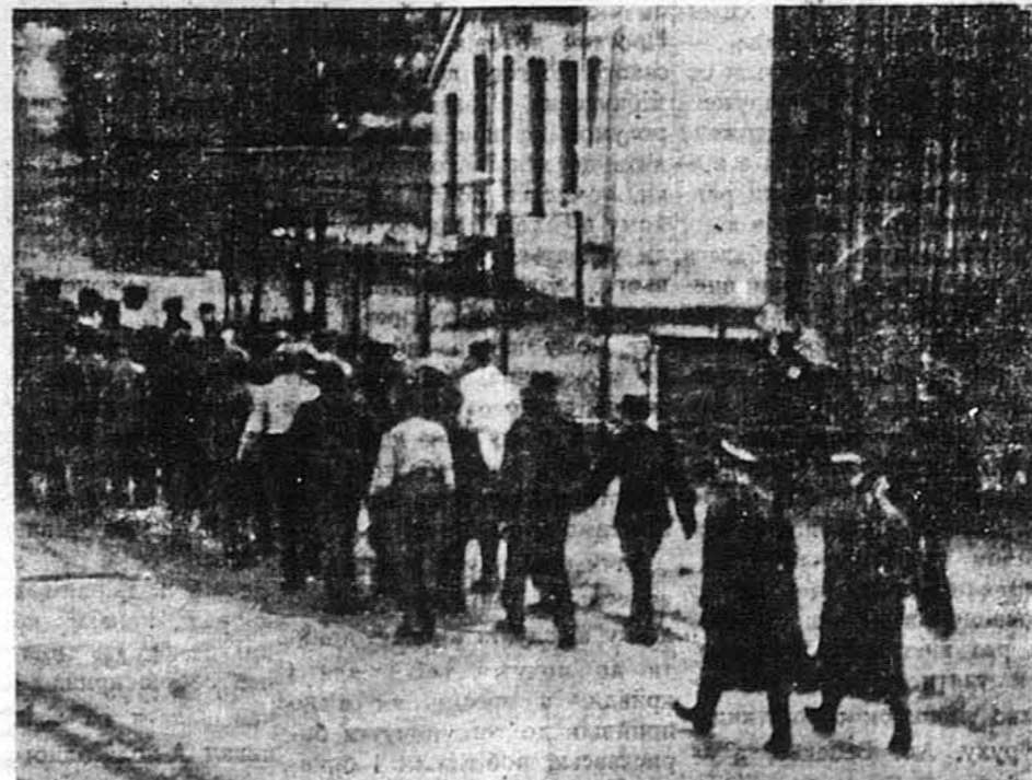
СЛУГИ НАЦІСТІВ.—Норвежці під нацистичними сторожами машерують вулицями міста Тронему по дорозі до табору праці. Це політичні бранці, що колись займали становища в норвезьких громадянстві. Світлину перепачковано з Норвегії.

СТОКГОЛЬМ. — Рапорти з Німеччини, одержані в різних неутральних центрах, дозволяють неутральним газетарям припускати, що німецьке заламання наступить десь на початку найближчого року, якщо не до кількох тижнів. Не дивлячися на всі зусилля Гестапо, в Німеччині скоро назриває різкий поворот у народних настроях: з подиву для Гітлера народжується переконання, що Гітлер німецький народ одурив. Серед такої ситуації янебудь найменша іскра може спричинити пожар, який обхопить цілу нацистичну будову.