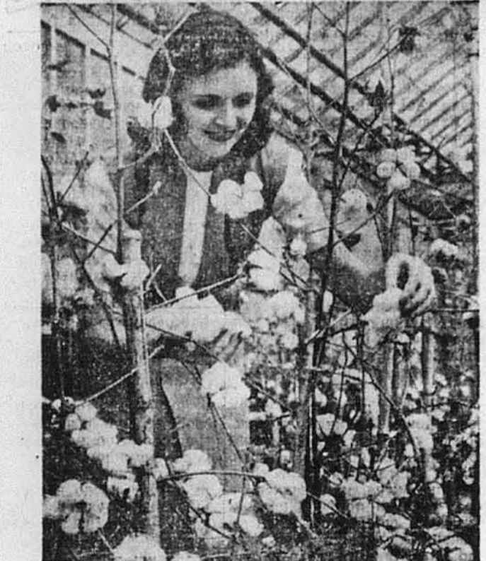
ДЕСЬ У КОНЕТИКОТІ. — Прийшов час зборів бавовни в Стемфордї, в стейті Конетикот. Це відай перші збори бавовни в тому стейті. Спробу з її управую зроблено в лабораторіях підприємства „Америкен Сай-енемид“.