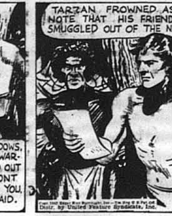
Тарзан насупився, прочитавши записку, яку перепечкував з табору його приятель Д'Арнот.