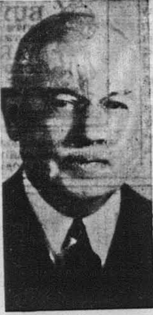
Walter E. Edge