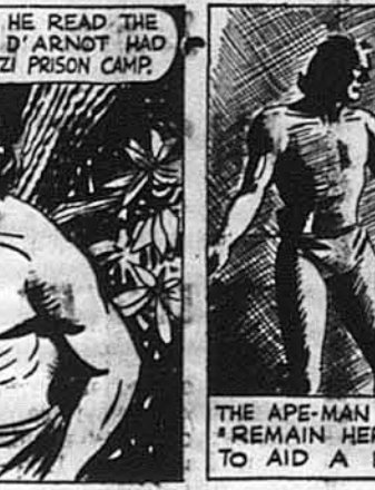
Тарзан пішов поспішно до Зілі. „Ти лишишся тут, а я їду помогти приятелю".