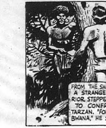
З тіней дерев виступив дивний вояк і станув перед Тарзаном. „Для вас", сказав він.