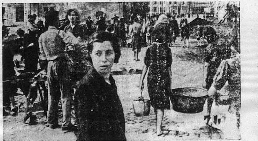
ДОРОГОШННА ВОДА.—Населення Неаполю через цілу добу по вході аліантських військ до міста, товпилося коло водопроводів, аби дістати води. Німці були поспули водопроводи, а британські інжиніри направили водопроводи.

Владко Мачек вислухав пропозиції, подякував за довіру, і сказав, що добрий кожух, але не на нього шитий. Мачек не хотів бути люкаем берлінських бандітів; не хотів бу-