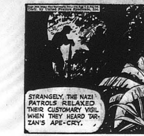
ТАРЗАН, ч. 863. Через ворожі лінії.

STRANGELY THE NAZI PATROLS RELAXED THEIR CUSTOMARY VIGIL WHEN THEY HEARD TARZAN'S APE-CRY.