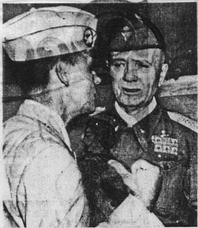
МАРШАЛ-ПРЕМ'ЄР ІТАЛІЇ.—Маршал Піетро Бадоліо, італійський прем'єр, на розмові з ген. Тейлором, заступником начальника Аліантського Військового Уряду.