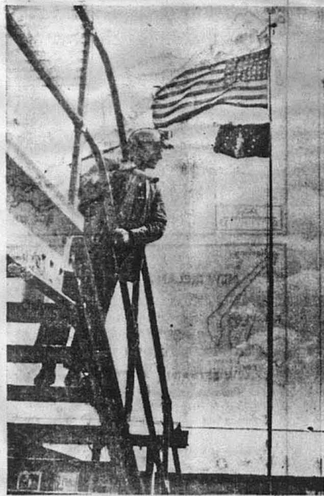
ДЯДЬКО СЕМ ЗАНЯВ.—Американський прапор повіває над капальнею підприємства „Литсбург Кова Ко.“ у Лайбрірі, Па., на основі наказу президента Рузвельта про перебрання копалень, котрих майнери виїшли на страйк.

в Парижі й арештувала кілька сот жидів. Їх тримали кілька днів в місцевій тюрмі, а потім замкнули в концентраційному таборі біля Парижа.