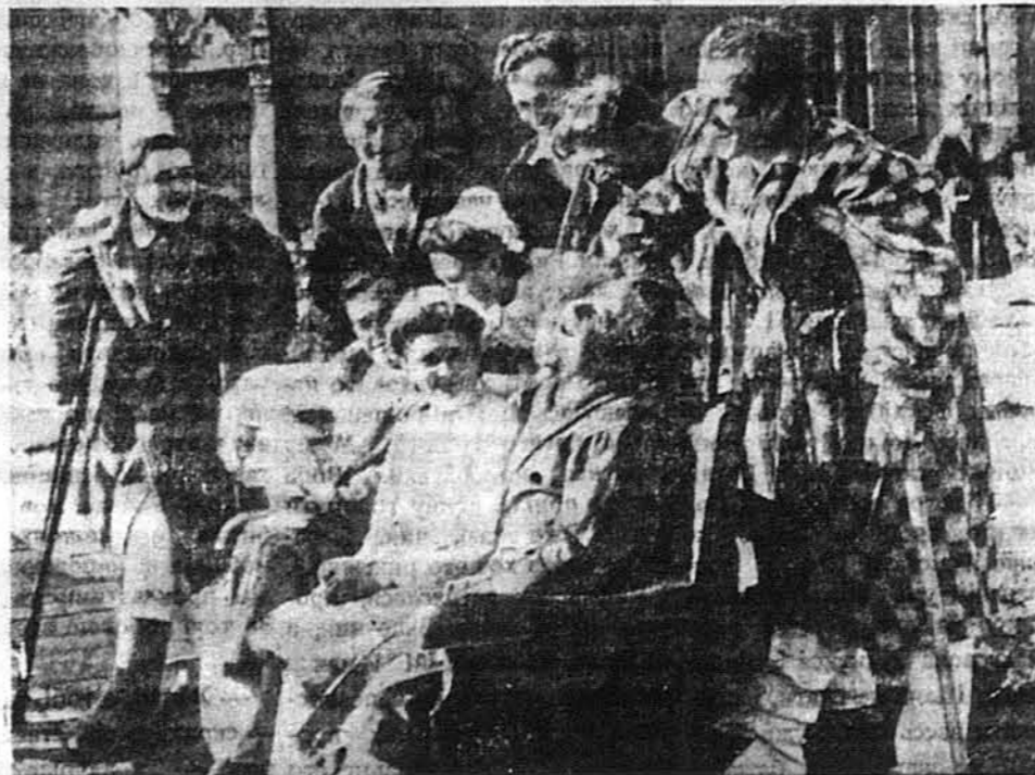
РАНЕНІ ПОЛЬСЬКІ ВОЯКИ лікуються в британському шпиталі в Шкотляндії.

АЛЖІР. — Генерал Де Гол заявив тут, що Французький Комітет для Національного Визволення це одинока влада, яка має якунебудь вартість у Франції й яку визнають французи. Він заявив теж, що досі йому не вдалося добитись якоїсь виразної угоди з Аліантими. Ця заява викликає занепокоєння серед французів, бо Аліанти тепер можуть подиктувати, хто з французів має ввійти до Франції й що він має робити по приході туди. Комітет має труднощі теж з комуністами. Він запросив комуністів до участі, але комуністи досі не дали ще нікому повновасти.