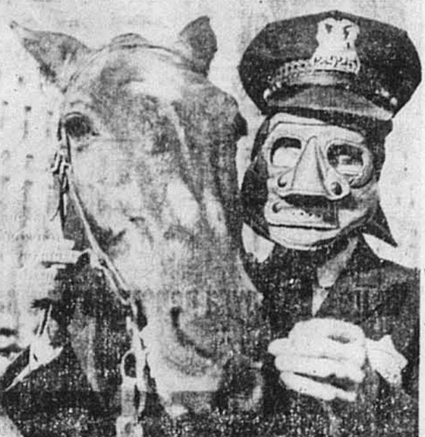
МОЖНА НИМ ЛЯКАТИ ДІТЕЙ. —Цей шикаговський поліцай зовсім не має наміру страшити дітей, що не хочуть їти спати. Це він тільки одів на обличчя маску, що має захоронити його від перемороження або від дощу. Кризь неї він може всеще курити, говорити, або почихатися в ніс.