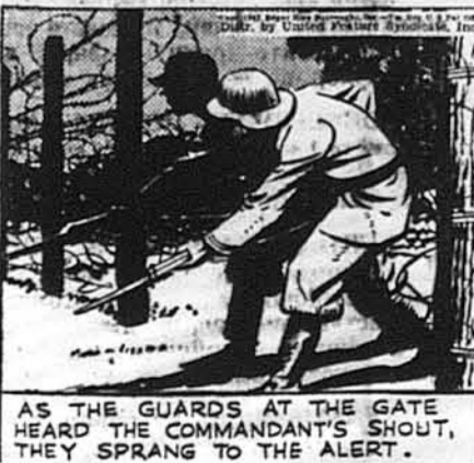
AS THE GUARDS AT THE GATE HEARD THE COMMANDANT'S SHOUT, THEY SPRANG TO THE ALERT.