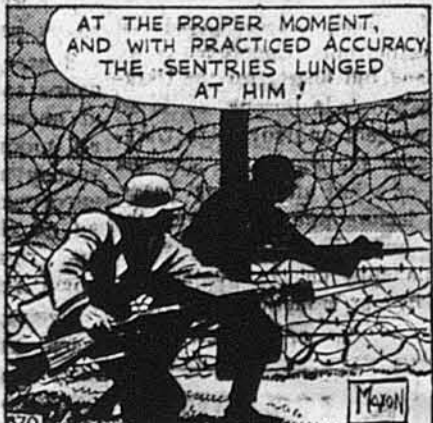
AT THE PROPER MOMENT, AND WITH PRACTICED ACCURACY, THE Sentries LUNGED AT HIM!

Як сторожі при брамі почули крик команданта, вони скоотчили на позір.