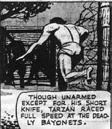
THOUGH UNARMED EXCEPT FOR HIS SHORT KNIFE, TARZAN RACED FULL SPEED AT THE DEADLY BAYONETS.