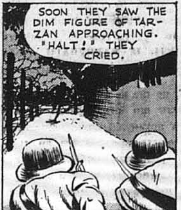
SOON THEY SAW THE DIM FIGURE OF TARZAN APPROACHING. "HALT!" THEY CRIED.