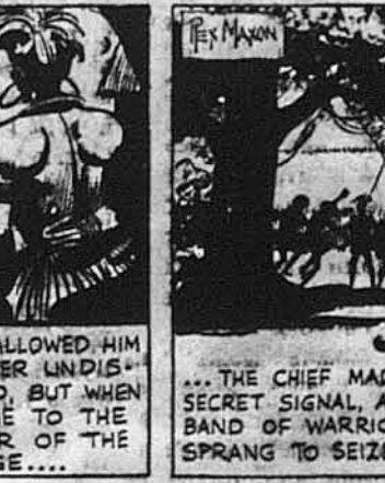
...вожд дав тайничий приказ, і банда воєків кинувся, аби його схопити.