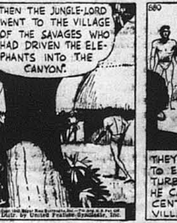
Вони позволили йому ввійти до села, але як він був у сере-дині...