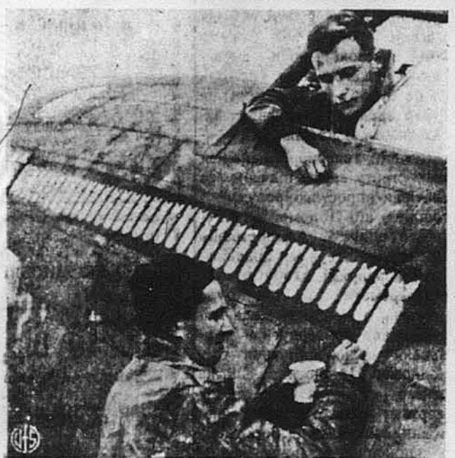
ВІДЗНАКА Й ВІДЗНАЧЕННЯ. На отсін літаку нама-льовують велику бомбу на знак, що літак відбуд уже 50 бомбових рейдів.