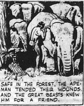
Безпечний у лісу, Тарзан за-осмотрив їх рани, і великі звірі стали його приятелями. Потім Тарзан пішов до села дикунів, що загнали слонів у пастку.