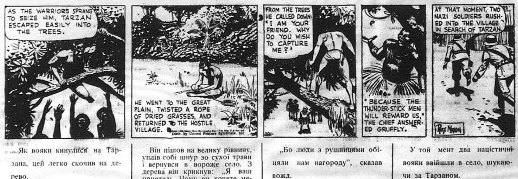
AS THE WARRIORS SPRANG TO SEIZE HIM, TARZAN ESCAPED EASILY INTO THE TREES. HE WENT TO THE GREAT PLAIN, TWISTED A ROPE OF DRIED GRASSES, AND RETURNED TO THE HOSTILE VILLAGE. FROM THE TREES HE CALLED DOWN: "I AM YOUR FRIEND. WHY DO YOU WISH TO CAPTURE ME?" AT THAT MOMENT, TWO NAZI SOLDIERS RUSHED INTO THE VILLAGE IN SEARCH OF TARZAN. "BECAUSE THE THUNDER-STICK MEN WILL REWARD US," THE CHIEF ANSWERED GRUFFLY.