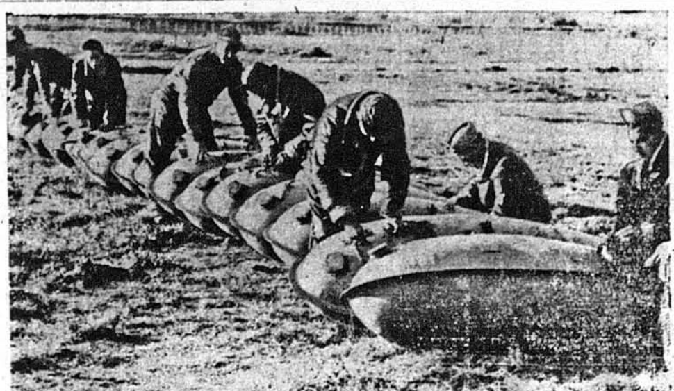
І ЦЕ БОМБИ, АЛЕ БОМБИ МИЛОСЕРДЯ.—У середні цих бомб містяться не ви-бухові матеріяли, а медичні припаси. Американські летуни скинуть ці бомби військам п'ятої альянтської армії, що воюють на важко доступних горах в Італії.