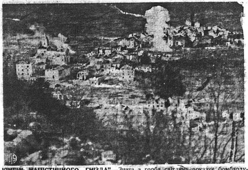
КІНЕЦЬ НАЦИСТИЧНОГО „ГНІЗДА“.—Знята з гора світлиня показує бомбардування італійського міста Венафра, в котрім осадовилися німецькі війська. По них бе аліантська артилерія. В цьому менті вибухали дві гарматні кулі. У церкві на ліво, за котрою вибухає бомба, находилася головна квартира німецьких військ.

Польські круги кажуть, що Міколайчик уже зовсім певно вибирається до Вашингтону на розмови з американським урядом. З ним іде теж Тадеуш Ромер, міністер заграничних справ. Перед відздом до Америки польські міністри будуть конферувати ще з Бенешем, президентом Чехословаччини, що вертається до Лондону з Москви, де він підписував договір між советським союзом і Чехословаччиною.