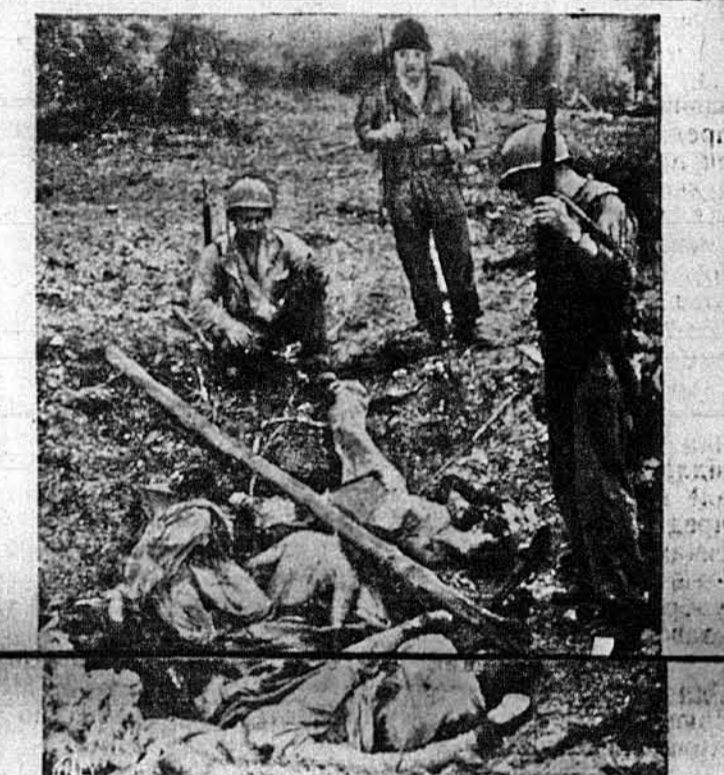
СИМ ДОБРИХ ЯПОНЦІВ.—В одній „лисячій ямі“ на острові Новій Британії загинуло від одної ручної американської бомби сім японських вояків. Американські вояки в наступі наперед задержуютьс, аби побачити, чи з них котрий ще не живе.

В КОЖНІЙ УКРАЇНСЬКІЙ ХАТІ ПОВИНЕН ЗНАХОДИТИСЯ ЧАСОПИС „СВОБОДА“