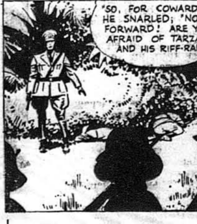
„Так належить трусам", він заявив. „Тепер наперед. Чи боїтеся Тарзана й його шумовиння?"