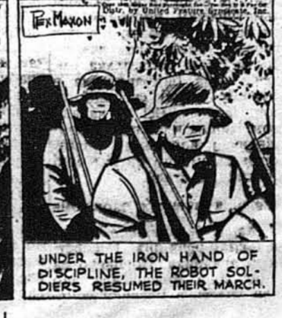
Під залізною рукою дисципліни, бездушні вояки пішли маршом.