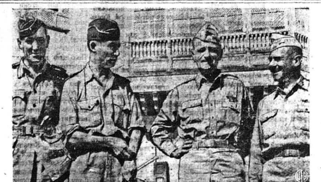
КОМАНДАНТИ ЛЕТУНСЬКОЇ ІНВАЗІЇ. — Отсіх летунів вибрав собі генерал Айзенгеров на командантів інвазії в Європі. Від лівої руки до право: британський повітряний маршал сер Артур Коннінгем; британський начальник летунства, маршал сер Артур Тедер; генерал Карл Спау, американський командант стратегічних сил над Європою; і генерал Дуліта, новий командант американської восьмої повітряної сили в Європі.

СТОКГОЛЬМ. — З Данції прийшли вісти, що саботажники ушкодили поважно корабельні доки в Копенгазі, в котрих будується кораблі й машини для Німеччини.