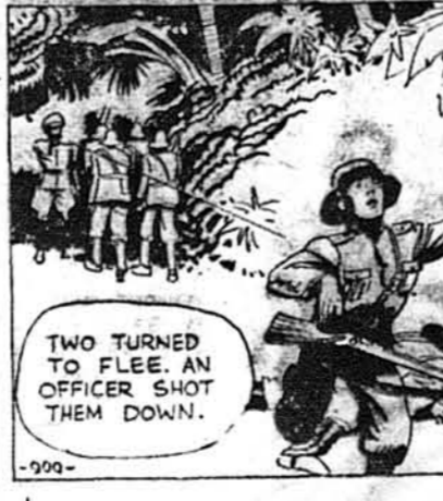
Двох звернулося до втечі, але один офіцер їх застрелив.