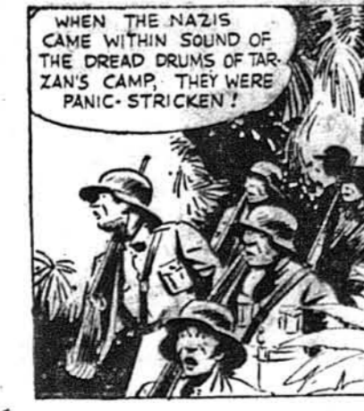
Як нацисти підійшли до табору Тарзана на стільки, що почули бубни, їх схопив страх.