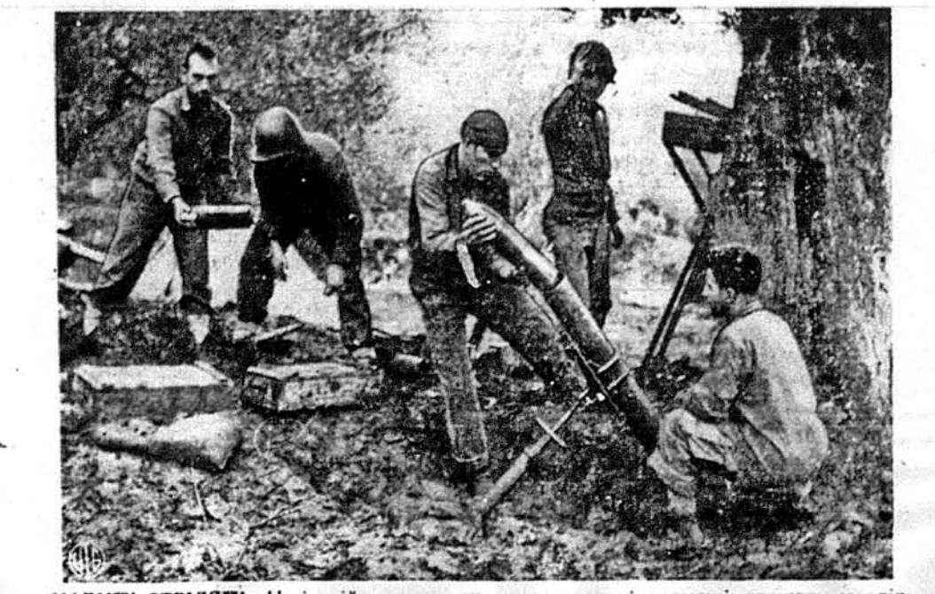
НАБИІ! СТІЛЯІ! — На італійському верху американські гармаші ладують мотдр, з котрого стріляють на німців у долині. На задньому тлі сержант підносить руку, аби дати сигнал стріляти.