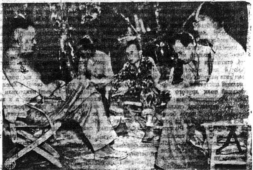
РОСПИТУЮТЬ МОРСЬКОГО СОБАКУ. — Газетярі роспитують адмірала Вільяма Ф. Галсія, команданта флоту на південному Паціфіку. Цей "морський собака" (так називають старих і досвідчених моряків) при розмові з газетярями зняв не тільки блюзку, але й сорочку, відкриваючи татуоване, за моряцьким звичаєм, рамя.

Ходять чутки, що папа Пій вставлявся за засудженими, ще дшш, що Чяно прибував утікати. Італійські газети в Швайцарії називають суд клявним над судівництвом, бо суддями були самі прихильники Мусоліні і суд відбувся тайно. Ходять теж чутки про арешт Каряя Скорни, секретаря фашистської партії.