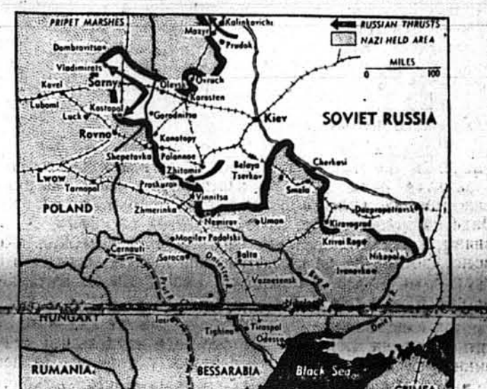
КАМПАНІЯ ЧЕРВОНОЇ АРМІЇ ЗА РІВНО. — Карта показує, як червона армія вгриється в глибину передової Польщі. Ризька границя між Польщею й советською Росією починається на північ від Черновців. Червона армія зміряє до захоплення Рівного, ключевого залізничного пункту. Кропкована лінія здовж Прута показує нову румунсько-советську границю.

В КОЖНІЙ УКРАЇНСЬКІЙ ХАТІ ПОВИНЕН ЗНАХОДИТИСЯ ЧАСОПИС „СВОБОДА“