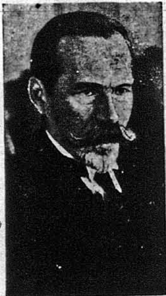
Антанас Сметона, Покійний президент Литви.

Недавня трагічна смерть президента Литви Сметони — у подумках горючого дому в Клівленді наводить на пам'ять знайомство й зустрічі з цю достойною, високо-культурною й незвичайно милою людиною. Було це в р. 1935, коли моя дружина — Марія Сокіл — і я поїхали при кінці жовтня до Литви, запрошені туди на низку виступів. Іхали ми в ненадто рожевім настрою, знаючи, що Литва — маленька держава, а її столиця, Кавнас, ще двадцять літ тому маленьке, неважне місто на окраїнах російської імперії. Отже, мислили ми, який — вже там є оперний театр, який оркестр? От, напевно — провінція!