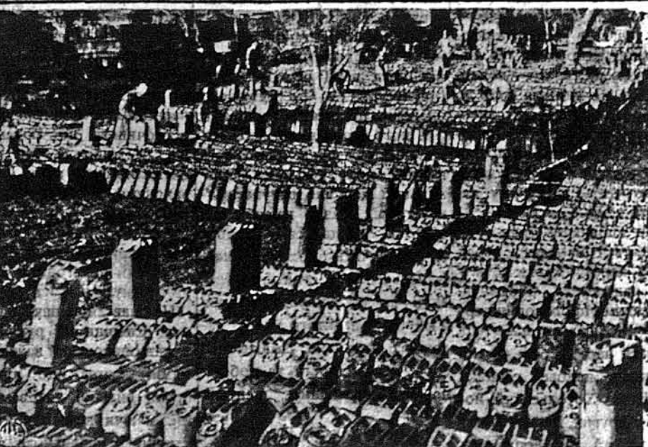
ДЛЯ ЗАОСМОТРЕННЯ ОЛИВОЮ. — Це кінцева станція рур на олій для аліянтських військ десь на італійським фронті. Тут олієм наповняють ці збірники, котрі потім служать для наповнювання літаків і повізів.

СТОКГОЛЬМ. — Одна шведка, що прибула недавно з Відня, оповідає, що Баллур фон Шрах, гавляйтер Відня, пробував утікати з Німеччини таким самим способом, як колись виїхав до Британії Гес. Нацистична поліція довідалася про заговор. Шрах це бувший провідник Гітлерівської Молоді й фаворит Гітлера.