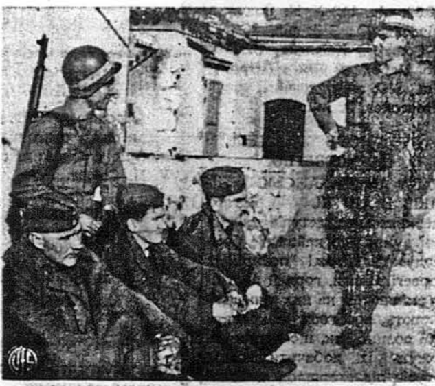
СТОРОЖАТЬ НАЦІСТИЧНИХ БРАНЦІВ. Два американські військові поліції стоять сторожами над трьома нацистичними вояками, що попали в полон в руки п'ятої альянської армії в Італії. Бранців вивільють до концентраційного табору на час тривання війни.