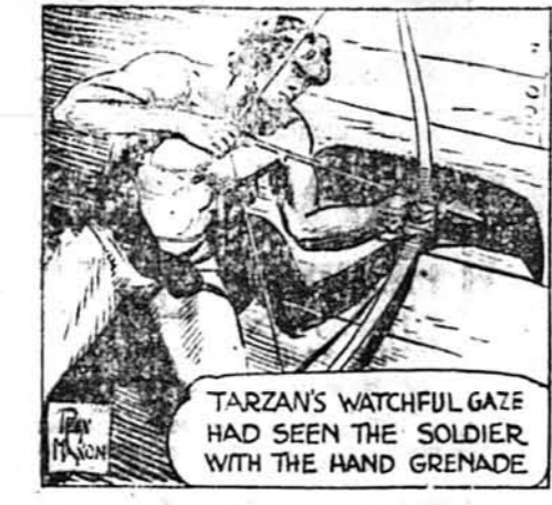
Тарзан, ч. 910. На нову небезпечу.