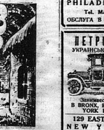
Потім великанський повз, покотився на головну квартиру табору... і нову небезпечу.