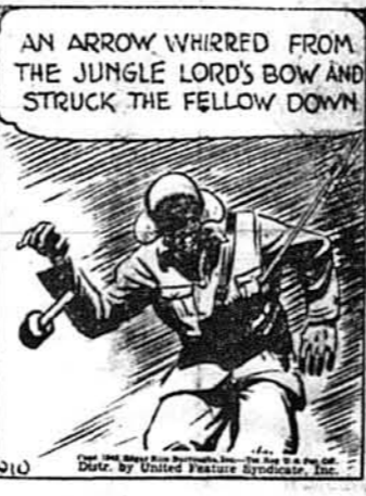
Бачаче око Тарзана побачило вояка з гранатою в руках.