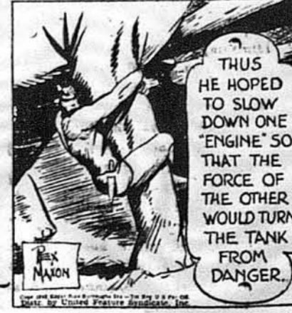
THUS HE HOPED TO SLOW DOWN ONE "ENGINE" SO THAT THE FORCE OF THE OTHER WOULD TURN THE TANK FROM DANGER.

Він зліз униз і обняв ногу одного слона.