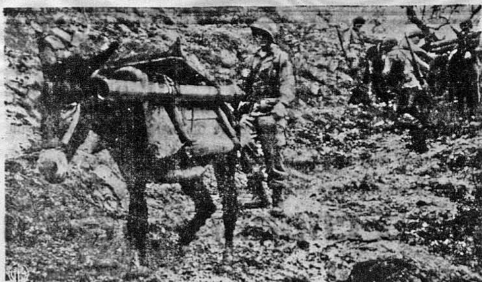
МУЛ УСЕ МУЛОМ. Чи він з Мезури, чи з Італії, він може легко впертися, і тоді хоч сядь і плач. Підчас походу гірської артилерії на позиції в Італії, один мул їде послухом, але інший вперся, і вояки не знають, чи його перти, чи злягати. На хребті першого 81-міліметровий мотзір.

роздумувань учених про вік Землі. Вчені стоять тепер на становищі, що колиб уся кількість оливи на Землі повстала з радіоактивних первнів урану і тору, тоді наша Земля мала би найбільше 8 мільярдів літ.