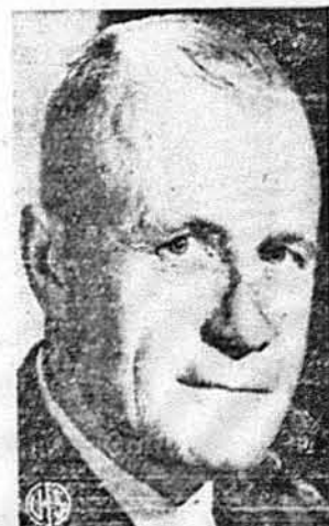
ГЕНЕРАЛ ДЖАН С. Г. ЛІ, котрого генерал Айзенговер іменував недавно тому заступником команданта на європейському воєнному театрі.

Свято закінчено відспіванням національних гимнів. Присутня.