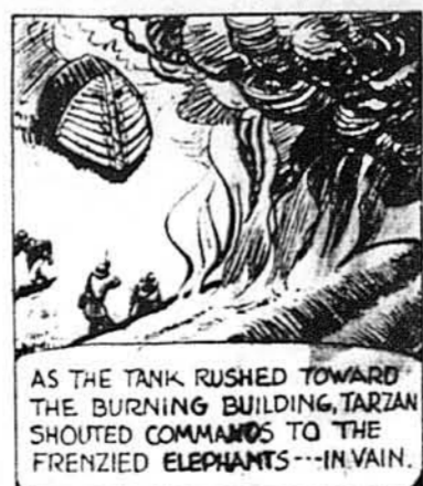
AS THE TANK RUSHED TOWARD THE BURNING BUILDING, TARZAN SHOUTED COMMANDS TO THE FRENZIED ELEPHANTS—IN VAIN.