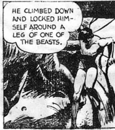
HE CLIMBED DOWN AND LOCKED HIMSELF AROUND A LEG OF ONE OF THE BEASTS.

Він зліз униз і обняв ногу одного слона.