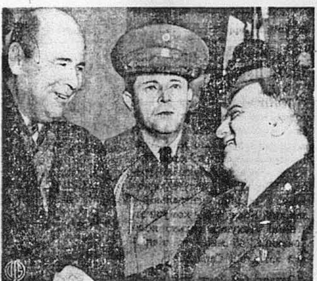
ІСАЯС МЕДИНА, ПРЕЗИДЕНТ ВЕНЕСУЕЛИ, південно-американської республіки, що тепер відвідує Злучені Держави, стрічається з ньюйоркським посадником Ля Гвардією.