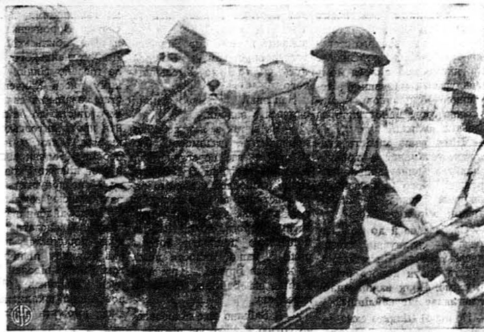
НА НОВИХ АЛІАНТСЬКИХ БАЗАХ В ІТАЛІІ. Бритійські „командоси“ й американські „рейнджери“, що становили головну силу аліантських військ, що доконали нової інвазії Італії, стрінулися коло Анціо й гратують собі взаїмно вдачній виправі.

МОСКВА. — „Ізвестія“, офіційний орган советського уряду, виступили за статею проти Ватикану. Згадуючи рапорт нью-йоркського Союзу Заграничної Політики, що мовляв в Італії можна ждати хвилі антиклерикалізму, „Ізвестія“ кажуть, що Ватикан від латеранського договору з Мусолінім, себто від лютия 1929 року, давав активну допомогу фашизму, і то не тільки в Італії, але й поза Італією. Тепер, кажуть „Ізвестія“, Ватикан платить за свою піддержку інвазії Етіопії. Ватикан мовляв помагав Гітлерівській й Мусолінівській авантурі в Еспанії.