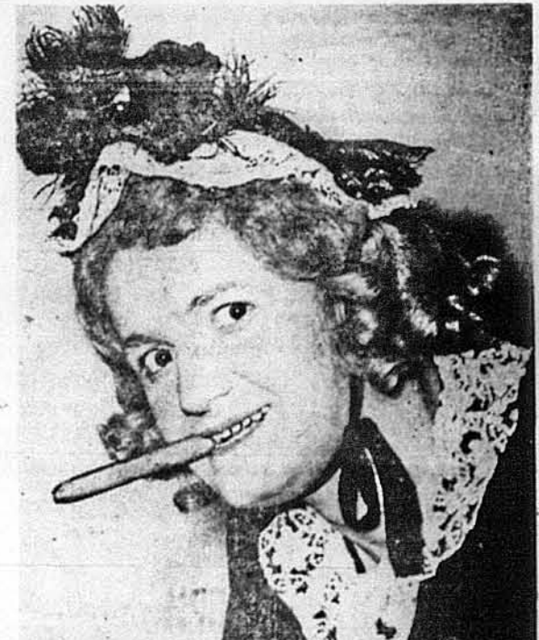
В ролі „Тітка“ виступає відомий комік Михайло Скоробогач, „Дмитро“ із фільму „Маруся“, якого признали американські критики як „FINE COMEDIAN“.

Завязті бої плачуть теж у Сл- авонії й Хорватії. В Альбаниї й Македонії партизани б'ються з німецькими військами й пома- гаючими їм німцями альбан- цями.