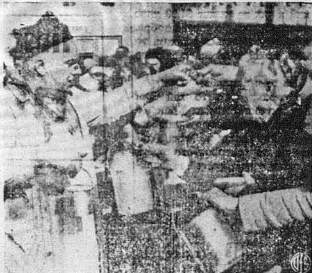
ПАЙКУВАННЯ ПОЖИВИ В ШВАЙЦАРІЇ. —Внаслідок загострення постанов про лайкування поживи, швайцарський народ у кантоні Тічина мусів закинути давній розділ різота для старців, хорих, недужих і сиріт перед постом, а завести замість цього нову страву, так звану „бусека“, густу зупу.

Прикмети природного асфальту. Асфальт — дарунок природи має ту прикмету, що має від давніх давен незмінний склад. Другою прикметою є вулканічний пил, що там нахочиться; він є такий дрібний, що переходить через густу білу фільтрування. Той пил, що нахочиться в асфальті, падає йому велику силу, що пікно виже камені та інші брукові матеріали і є причиною великої відпорності на