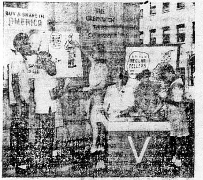
This photo taken at Stamford, Conn., shows school children "stamping out" Hitler with War Stamps on the street in front of the Greenwich Trust Company.