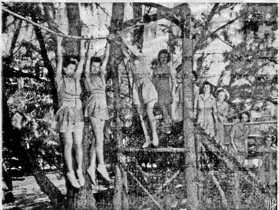
І ВОНИ ПЕРЕХОДЯТЬ ВИШКІЛ. В одному таборі для вишколу „Спарс“ів у Пам Бічу, на Флориді, ці дівчата, що служать при прибережній сторожі, переходять через строгий курс тілесних вправ.