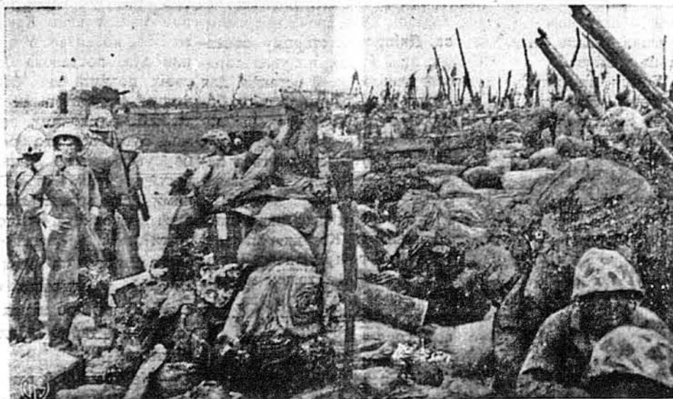
АМЕРИКАНЦІ СПРОВАДЖУЮТЬСЯ. — Величезні купи припасів для американських інвазійних військ залягли побережжя острова Рой, одного з островів Маршала, після висадження там американських воєків. Над імпровізованим табором стирчать стовбури пальм, розбитих передінвазійним бомбардуванням.

БАРСЕЛЬОНА. — Уряд у Віші знову примушує молодих французів виїжджати на фабричні роботи до Німеччини. Зарядження Ляваля викликають занепокоєння в Франції, котра відчуває недостачу робітників у фармерстві.