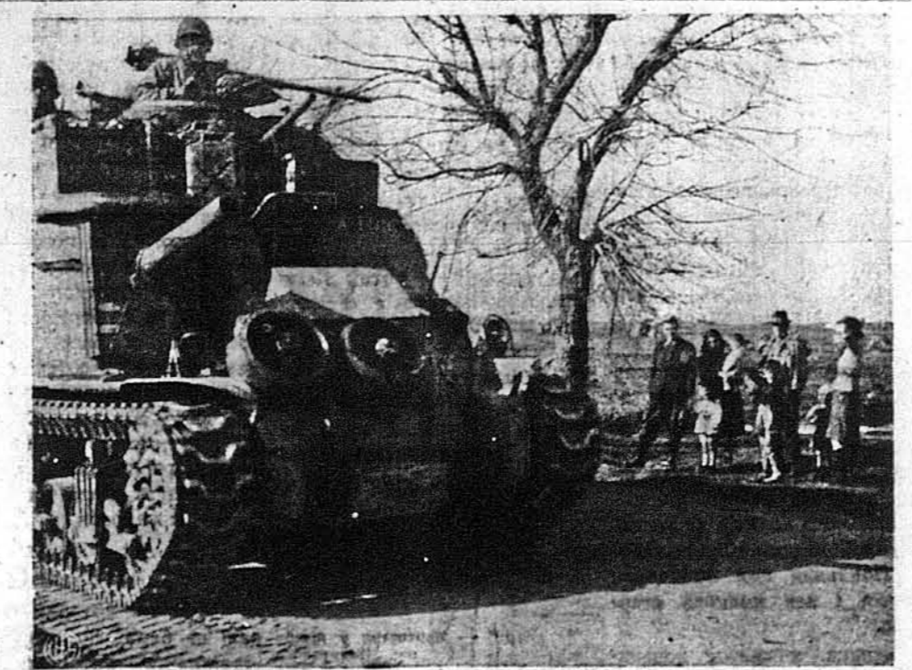
ІМПОЗАНТНА МАШИНА. — Американський повз, що іде гоштинцем між італійськими містами Анціо й Чистерія, певно робить глибоке вражіння на тубильців.

У парламенті виринула несподівано проти промови Чорчіля сильна опозиція. Закидали прем'єрови, що він поробив з Росією угоду, яких він соромиться виявити. Критиковано теж заяву, що Атлантийський Чартер не відноситься до Німеччини. Один посол сказав, що Чорчил не „Чарлі МекАрті“ Сталіна; інші висказували що думку словами, що британський уряд, замисль вести провід у східній Європі, дає себе вести Росії. Один з послів британської партії праці критикував безпощадне бомбардування Німеччини.