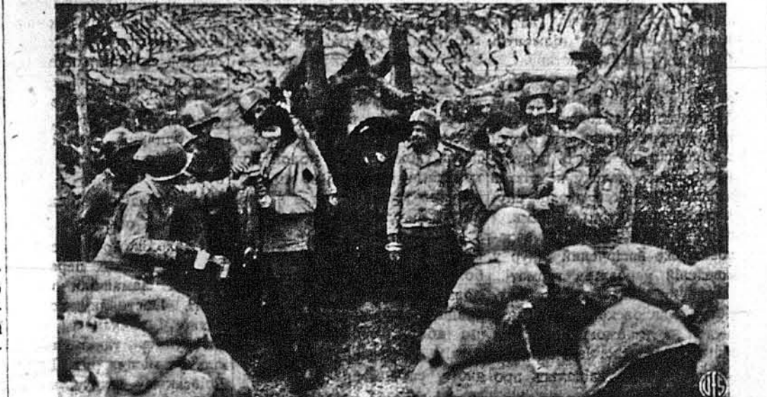
НА БОЄВИМ ФРОНТІ. — Десь в Італії близько боевого фронту дівачка Червоного Хреста роздають обарінки й каву воjakам американської гармати.

ЛОНДОН. — Советське інформаційне бюро російського комісаріату заграничних справ подало нарешті офіційний текст умов, що їх предложив советський уряд фінському: 1) Фінляндія мала би передусім зрівнати взаємнн з Німеччиною й інтернувати німецькі війська й кораблі в Фінляндії; 2) Фінляндія мала би привернути границі з 1940. року; 3) Фінляндія мала би негайно звільнити советських і інших аліантських воєнних бранців; 4) справу демобілізації фінської армії малося би лишити для дальших переговорів; 5) так само справу відшкодування советському союзови, зроблену військовими операціями; 6) як також питання округи Петсамо. Советське інформаційне бюро виразно заперече чулки, буцімто советський уряд домагається від Фінляндії безумовної здачі. У Лондоні признають советські умовини зовсім не важкими, колиб зважити участь фінів в облозі Ленінграду.