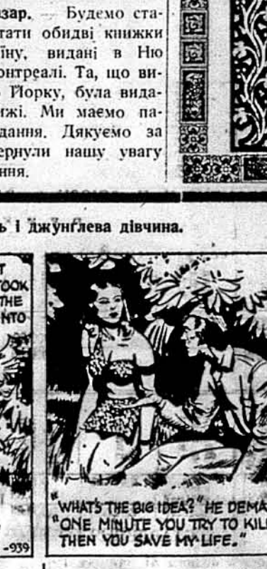
„Що це має значити?“ питався Слім. „Раз пробуєш мене вбити, то знову рятуєш мені життя“.