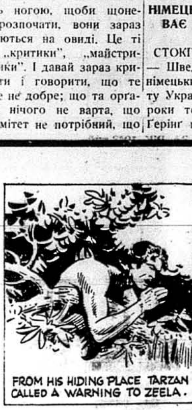
FROM HIS HIDING PLACE TARZAN CALLED A WARNING TO ZEELA.