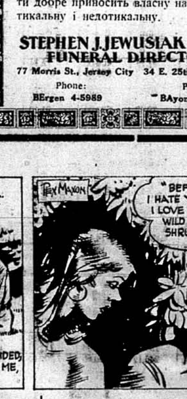
„Передим я тебе ненавиділа, а тепер тебе люблю“, сказала дівчина.