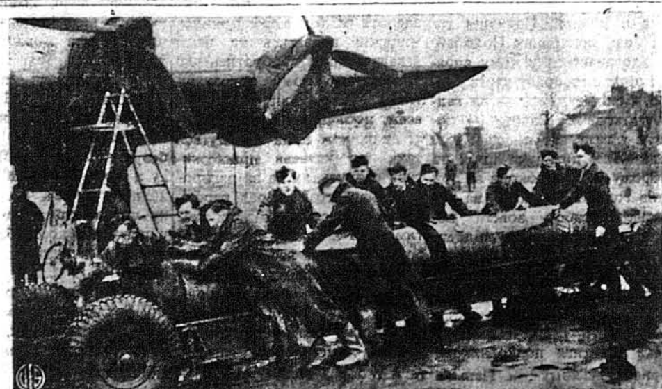
ДВО-ТОНОВІ БОМБИ. — На великий бомбівик системи Галіфекса вантажать десь у Британії дві бомби, по 4,000 фунтів кожна. Коли так виглядають дво-тонова бомба, можемо собі уявити, як виглядають бомби по шість тон, які останніми часами почали вживати аліантські летуни для розбивання фабрик.

Розкриття цієї заяви генерала викликає серед послів і публіки негодування проти уряду за її затанення.