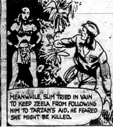
Тимчасом Слім пробував заставити Зілу не йти за ним. Він боявся, що її можуть убити.