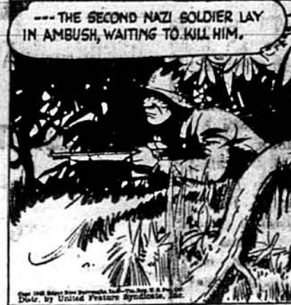
... другий нацистичний вояк засів на нього, ждучи до- гідної хвилі його вбити.