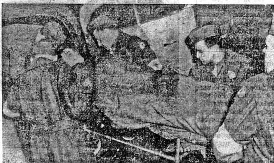
НАРЕШТІ ДОБИВСЯ ДО АМЕРИКИ.—Раненого американського вояка, одного з 35, що прибули оної до "Гріпсголі" до Джерзі Сіті, переносять з корабля до амбулансу. Його випущено з нацистичного табору воєнних п'лнників і він їде до генерального шпиталю Галорена на Стетен Айлєнді, в Нью Йорку, для докінчення лікування.