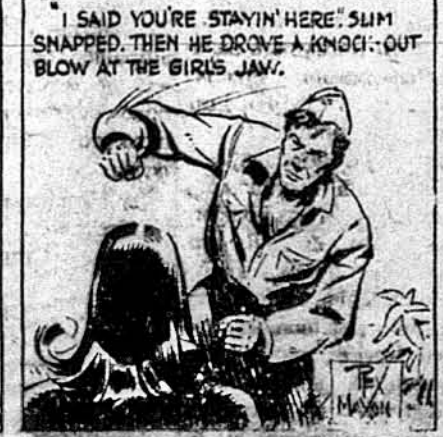
„Я казав тобі, що ти мусиш остатитись тут“, він сказв і вдарив її в щок.