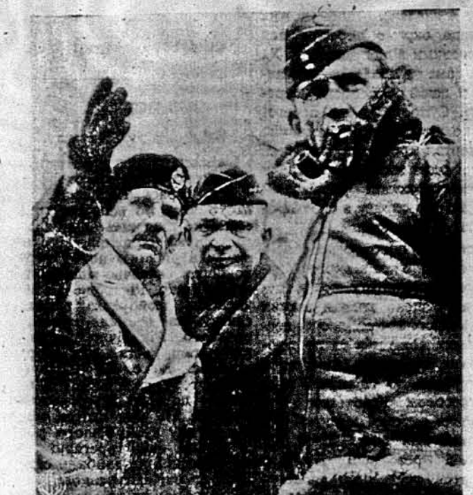
ТРИ АЛІАНТСЬКІ КОМАНДАНТИ конференціють цілчас недавніх інвазійних маневрів в Британії. Від лівої руки: британський командант сер Бернард Монтгомері; американський генерал Двайт Айзенгавер та сер Артур Тедер, заступник британського команданта.