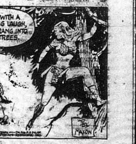
Слім замахнувся з усією силою, аби зробити Зілу нешкідливою.