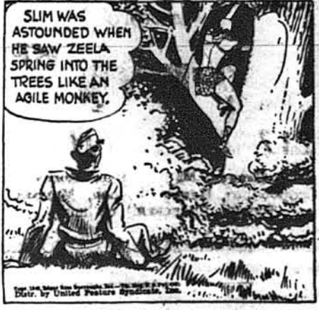
Слім здивувався, побачивши, як Зіла скочила на дерево, як малпа.