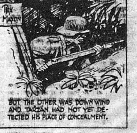
Та другий вояк стояв від вітру, і Тарзан ще не зачував віну.