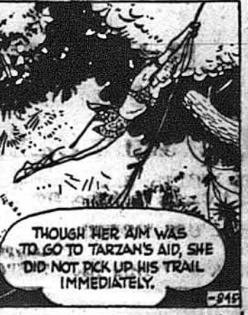
Хоч Зіла думала йти за Тарзаном, вона не відразу пішла тою дорогою.