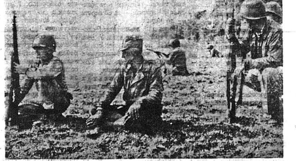
ПРИГЛЯДАЄТЬСЯ БИТВІ. — Генерал Джозеф Стілвел (у середині групи) приглядається з вершка високої скали над рікою Танай, в північній Бурмі, як його вишколені американськими китайськими військами переходять ріку в погоні за японцями. Підчас відступу японці понесли поваж втрати.