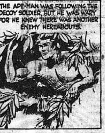
Тарзан далі йшов за вояком, але він знав, що десть там був ще один вояк.