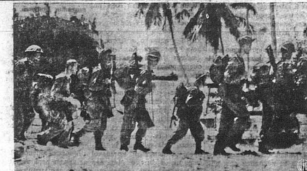
НОВО-ЗЕЛЯНДЦІ НА ОСТРОВІ ГРІН.—Вояків шойно висаджено на цей важний пункт, що лежить усього 140 миль від важної японської бази Равадлу.

Тимчасом зо Швайцарії доносять, що число людей, які внаслідок випадку втратили життя, дійшло до 48. Ранених є 70. Можливо, що під руїнами розбитих доміл найдеться ще більше жертв. Німецька пропаганда використовує помилку з усієї сили для витворення протиамериканських настроїв серед тих швайцарців, що говорять німецькою мовою.