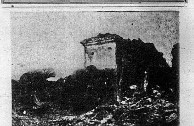
Сцена з „Україна в огні”, офіційного советського фільмового документу, котрий тепер висвітлюють у „Стейт Тейтєр” у Нью-Йорку.