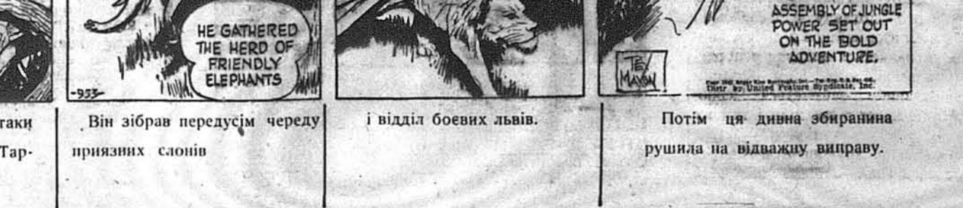
Приготовляючися до атаки на моторизований відділ, Тарзан зібрав усі свої сили.

(ОНА). — Польський уряд в Лондоні має новий клопіт. Жидівські воєвкв в польській армії обвинувачують офіцєрів, що вони замість виучувати воєну техніку і тримати в армії дисципліну, займаються антисемітизмом. Кілька десятків жи-