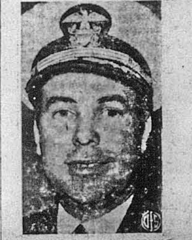
КОМОДОР ДОНАЛД МЕКДОНАЛД є найбільше разів відзначеним моряком американської військової флотії.

Ось це останнє являється для Істмена найважливіше. Про це він постійно пише, це він постійно нагадує, боючись, щоб великі демократії не пішли на задалекі уступки большевицько-тоталітарному режиму. А теж, щоб надто не вірили тому, що говорять про свою силу представники советського режиму. Істмен твердить, що правду про ту силу сказав Кравченко, подаючи як російський наряд відноситься до большевицького режиму. А Кравченко це заявив, що й