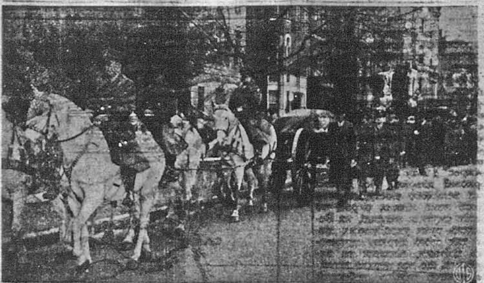
ВІДАЮТЬ ЧЕСТЬ ПОКИННОМУ ДИПЛОМАТОВИ. —Військо й урядники беруть участь у похороні Мануєла Фрейра, посла південно-американської республіки Перуві, що помер недавно в Вашингтоні. Тіло вивезено наперед на богослуження до католицької катедри, а потім на дворєць для висилки до рідного краю.

ПОТРІБНО МУЖЧИН COUNTERMEN досвідчених при саза- тах і сєвічах. Gateway Restaurant, Pennsylvania Railroad, Newark N. J.