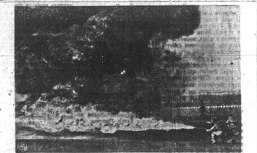
ВООУВАННЯ ОГНЕМ. — В якомусь таборі американської армії воєнків хемічного воювання демонструють викидання полумя на ворожі позиції. Вживається його передчасно для добування сильних цементових домиків, котрих не можна розбити гарматним огнем, так званих „пилбакс“. Полумя вбиває людей та псує матеріал.

ЛОНДОН. — Римське радіо подало, що в Сикстинській каплиці за славним образом Микельанджеля „Страшний суд“ відкрито неколкоку масилу. Німецьке радіо каже, що бомба дуже велика й виглядає на „бомбу британської роботи“.