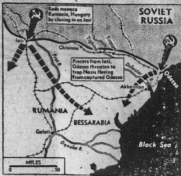
НАСТУП ЧЕРВОНОЇ АРМІЇ. Заявши Одесу, червона армія розвиває неможливі кліщі, котрих одно рамя виходить з Одеси, а друге з Ясів, а котримі вона пробуює захопити коло 100,000 німецьких, мадярських і румунських військ.

Тимчасом загадка цієї гаївки справді не легка. Думка, подана в останньому числі д-ром Павлом Дубасом, що ця гаївка бере своє жерело з відомої історичної події.