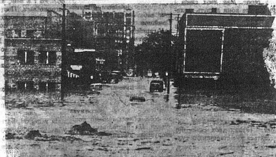
МОКРА ВУЛИЦЯ. — Як у Злучених Державах виллють дощі, то терплять часто й великі міста. Світлина представляє вулицю в Алянті, в стейті Джорджія, по недавній зливі. На середині дороги вершок авто, що ледво видніється з води.

Німецька пропаганда використовує британські обмеження дипломатів всіма способами, удаючи страшне обурення на цей „безоглядний”, „брутальний”, „жорстокий” поступок Британії.