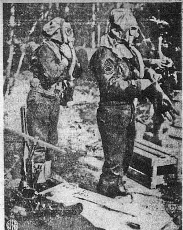
ГОТОВІ Й ДО ГАЗОВОЇ ВІЙНИ. — Якщо Гітлер думає ратувати себе в останній мінуті газовою боротьбою, то застане несподіванку, бо Аліанти готові й до такої війни. На образку бачимо двох американських вояків, що вправляються десь в Англії, як ратувати себе перед газовим затроєнням.

Американці мають вісти, що німці скріпляють свої позиції під Римом посиленнями артилерії з російського фронту.