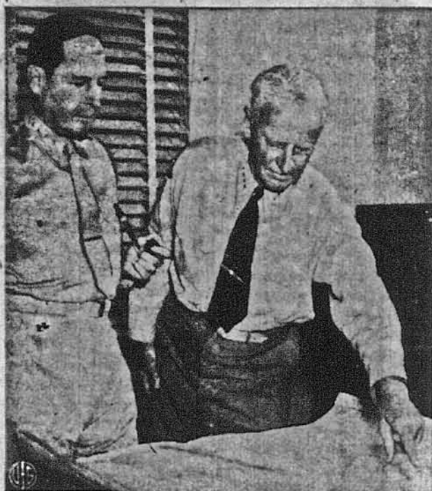
Пляни, що їх японці незабаром відчують на своїй шкірі. На образку бачимо генерала Доглеса МекАртура (зліва), начальника команданта полуднево-західного пачифічного фронту, і адмірала Честера В. Німіца, команданта флоту на Пачифіку, як планують спільні наступи на японців з боку армії і маринарки.

Військова газета хвалить рекорд продукції. Департамент Війни повідомляє, що середньо морське