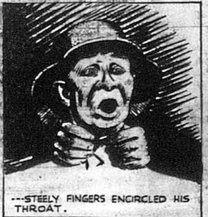
...STEELY FINGERS ENCIRCLED HIS THROAT.