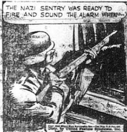
THE NAZI SENTRY WAS READY TO FIRE AND SOUND THE ALARM WHEN...

Такто Тарзан відніс першу перемогу в змаганню, але крізь за мала щойно прийти.