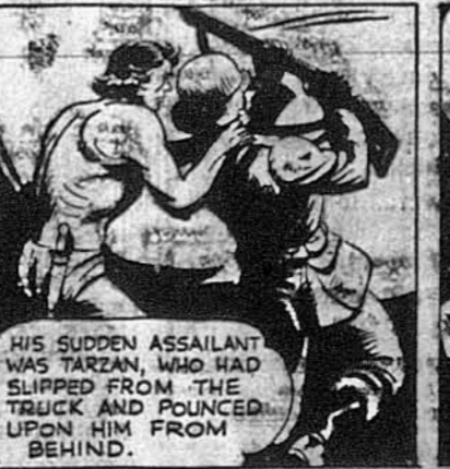
HIS SUDDEN ASSAILANT WAS TARZAN, WHO HAD SLIPPED FROM THE TRUCK AND POUNCED UPON HIM FROM BEHIND.