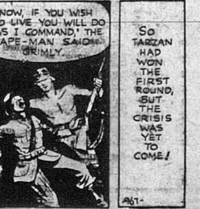
NOW, IF YOU WISH TO LIVE YOU WILL DO AS I COMMAND! THE APE-MAN SAID GRIMLY.