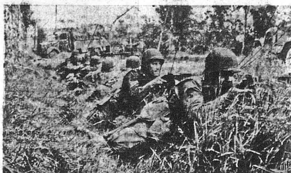
ЗАКРИТІ В РОВІ. — Американські вояки під Сан-Сопер-ле-Вікомт, у Франції, іхали троком по гостинці, коли на них стали летіти німецькі кулі. Вони зішли з троків і залягли в рові, аби відбити німецький напад.

Американський прапор для цього пам'ятника передержує управа міста. Його привезено на ганок церкви св. Марка. Коли вже все було готове до дедикації, рознісся голос воєнної трубки, а 4 вояки зоружені крісами перенесли прапор з церкви під пам'ятник, де віддали його комітетові будови пам'ятника. Вчасі цієї церемонії весь нарід стояв на позір, а поліція уладила шпалір між збитою масово публікою.