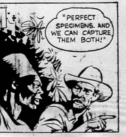
„PERFECT SPECIMENS, AND WE CAN CAPTURE THEM BOTH!"

Тарзан і гориль зчепилися в завзятім бою.