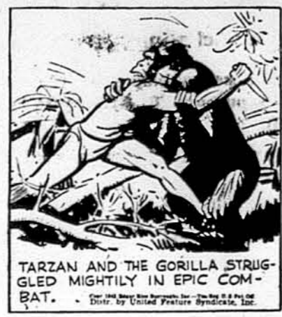
TARZAN AND THE GORILLA STRUGGLED MIGHTILY IN EPIC COMBAT.