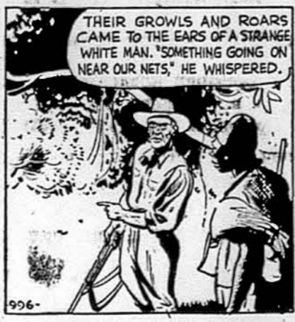
„THEIR GROWLS AND ROARS CAME TO THE EARS OF A STRANGE WHITE MAN. SOMETHING GOING ON NEAR OUR NETS," HE WHISPERED.