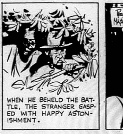
WHEN HE BEHELD THE BATTLE, THE STRANGER GASPED WITH HAPPY ASTONISHMENT.