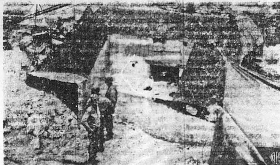
НЕ ВИДЕРЖАВ. — На світліні видно одну одиницю з широко Гітлером розголошеного „західного“, чи „Атлантийського“, „муру“, що мовляв є такий сильний, що ніхто його не потрапить розбити. Та цей форт не потрапив видержати гарматного огню з американських воєнних кораблів. Тепер його вживають Аліанти як постою для своєї команди.

Лондонські поляки, згрупувані довкола польського уряду на вигнання, дивляться дуже песимістично на останні події в совєтським союзі. Вони добачують у них докази, що навязання наново кращих взаємин між лондонським урядом і совєтським урядом тепер уже просто неможливе.