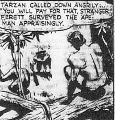
TARZAN CALLED DOWN ANGRILY... YOU WILL PAY FOR THAT, STRANGER! FERETT SURVEYED THE APE MAN APPRAISINGLY.