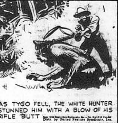
AS TYGO FELL, THE WHITE HUNTER STUNNED HIM WITH A BLOW OF HIS RIFLE BUTT.