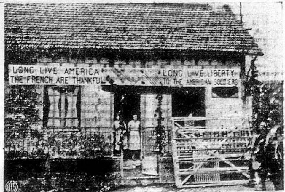
ЧЕТВЕРТОГО ЛИПНЯ В ФРАНЦІЇ. З влячності за визволення мешканці міста Лі Мін у Франції удекорували цей дім прапорами й відповідним написом. Чорні п'ятна на світлині зробив цензор, замазуючи інформацію, яка могла би придатися ворогови.

ШЕРБҮРґ. — Перед вільним французьким судом ставлено як обвинувачених за зраду Франції двоє молодих французів. Не дивлячись, що їм вину доказано понад усякий сумнів, суд не видав звичайного в таких випадках присуду смерті, але засудив їх на дремертну в'язницю. Суд взяв під увагу низку облекшуючих умовин; передусім їх молодий вік, як також те, що вони виростили без батьківського догляду, а до того ще вчасі, коли такий визначний чоловік, як маршал Петен, пропаґує співпрацю з ворогами Франції.