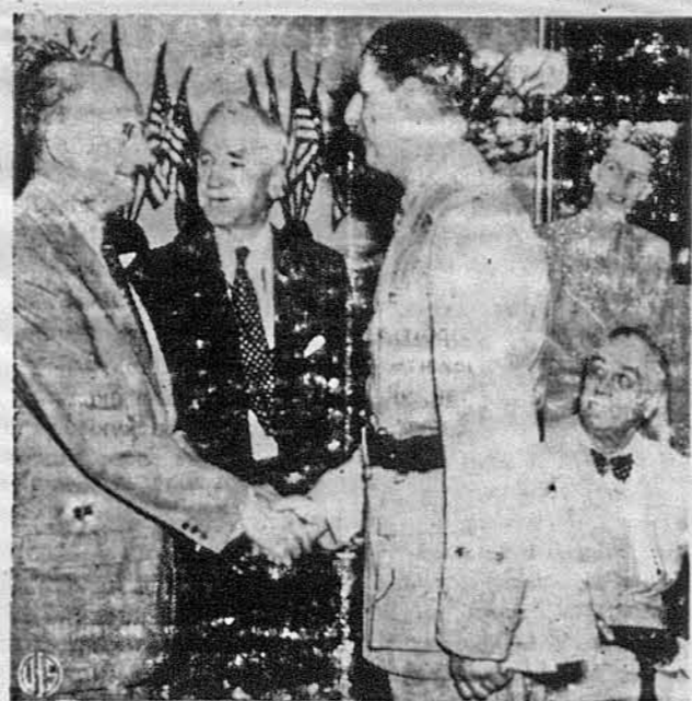
ВІДВИДИНИ ДЕ ГОЛА В АМЕРИЦІ. — Французький генерал Де Гол, що все стояв за боротьбу французів проти німецької окупації, відвідав оноди Злучені Держави. На світліні: Де Гол, стрінувся вже в Білому Домі з президентом Рузвельтом і витьається за секретарем скарбу Генрім Моргантавом. Між ними секретар стейту Кордел Гол, поза ними пані Бовтінгер, дочка президента Рузвельта.

„Про артистичну вартість пам'ятника Б. Хмельницькому трудно судити, бо він лишився не докінченим, і постамент до його прироблено обіж, на швидку. О скільки нам траплялось чути й читати про такий присуд, фахові знавці високо оцінюють кінну статую Хмельницького, як справжній художній твір; але цього ніяк не можна сказати про незграб-