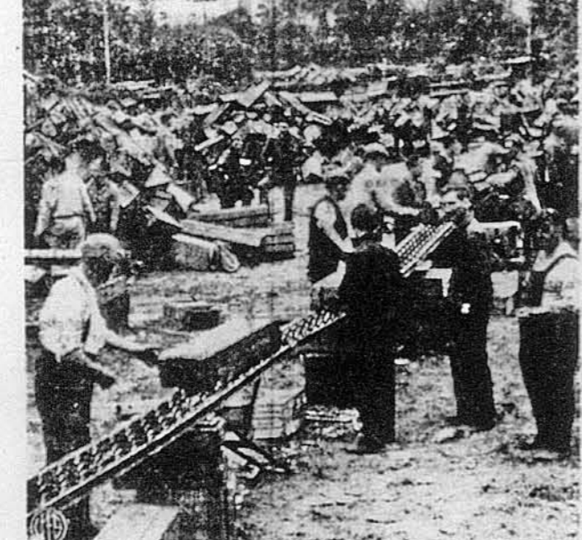
ФРАНЦУЗИ ПОМАГАЮТЬ АЛІЯНТАМ. Французьке цивільне населення знаходить працю при аліянських військах у Нормандії. На світліні, група французів помагає сорувати амуніції при одному з великих магазинів зброї на прибережному підмісті.

ОПЛАТА УМІРКОВАНА. — МЕДИЧНА ЕКЗАМІНАЦІЯ $2 DR. ZINS (28-літнє заведення) 110 EAST 16th STREET (Union Square) NEW YORK, N. Y. Щоденно від 9 г. рано до 7 г. веч. У неділі від 9 г. рано до 2 попа.