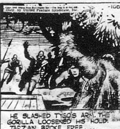
HE SLASHED TYGO'S ARM. THE GORILLA LOOSENED HIS HOLD. TARZAN BROKE FREE....