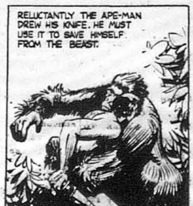
RELUKTANTLY THE APE-MAN DREW HIS KNIFE. HE MUST USE IT TO SAVE HIMSELF FROM THE BEAST.