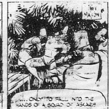
... ONLY TO FALL INTO THE HANDS OF A SQUAD OF ASKARIS.