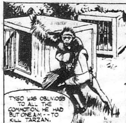
TYGO WAS OBLIVIOUS TO ALL THE COMOTION. HE HAD BUT ONE AIM -- TO KILL TARZAN.

Коли саме наступить поворот офіцерів з Англії до краю, ніхто напевно не знає, але офіцери певні того, що як тільки польський уряд договориться до Советами, то військові люди негайно вернуть ся домів.