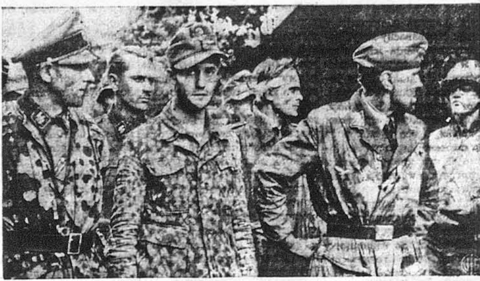
ПОПАДАЄТЬСЯ В АМЕРИКАНСЬКИЙ ПОЛОН САМА „СМЕТАНКА“. — На образку бачимо найзавзятіших нацистів, німецьких офіцерів з штурмової другої танкової дивізії, що попали в американський полон біля Авранш в Франції. Їх допитують, заки вишлють до табору полонених. Особливо питають про те, як нашіти готуються до війни в — 1964 році.

БЕПС (Франція). — Андре ле Трокер, французький комісар для визволених територій, заповів, що Алянти здобудуть Париж впродовж наступних 10 днів. Каже, що зараз перенесеться до Парижа ген. де Голь та французький уряд, що є в Альжирі. Найбільша жура буде в тому, щоб доставити Парижеви поживу, бо місто голодує.