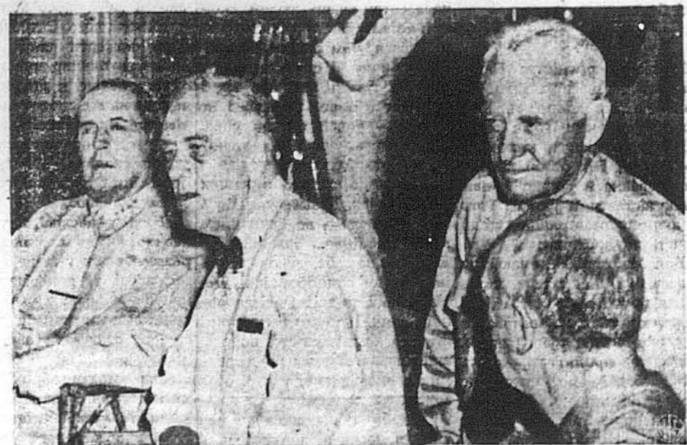
ПРЕЗИДЕНТ РУЗВЕЛТ КОНФЕРУЄ НА ПАЦИФІКУ З СВОЇМИ ГЕНЕРАЛАМИ. — Президент Рузвелт, приглянувшись з великим вдоволенням вїдбудові Перл Гарбор та тому, що осягнули американські та аліянтські війська на Пацифіку від часу війни з Японією, відбув конференцію з американськими командантами в справі нових ударів ворогові. На образку зліва на право: ген. Доуглс МекАртур, президент Рузвелт, адмірал Честер В. Нимиц, адмірал Вільям Д. Лейгі, дорадник президента.

АЛЬЖИР. — Тим, чим є безпека на Пацифіку для Злучених Держав Америки, є для французів безпека над Реном, заявив ген. Шарль де Голь, голова Французького Комітету Національного Визволення.