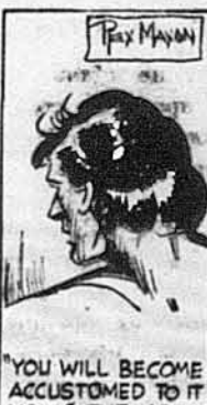
"YOU WILL BECOME ACCUSTOMED TO IT NOW," THE APE-MAN GROWLED.

„Алеж авто розбите. Дідусь не чується добре, а я не привикала ходити“, сказала Жуана.