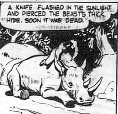
A KNIFE FLASHED IN THE SUNLIGHT AND PERCED THE BEAST'S THICK HIDE. SOON IT WAS DEAD.

Як носоріг кинувся вперед, майже нагий чоловік упав на нього з дерева.