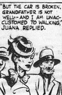
"BUT THE CAR IS BROKEN. GRANDFATHER IS NOT WELL--AND I AM UNACCUSTOMED TO WALKING," JUANA REPLIED.

Тарзан приказав здивованим людям: „Втікайте, ці ліси повні диких звірів“.