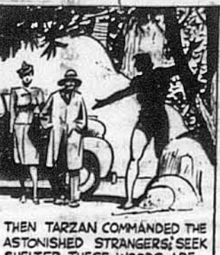
THEN TARZAN COMMANDED THE ASTONISHED STRANGERS: SEEK SHELTER. THESE WOODS ARE FULL OF WILD BEASTS.

Блиснув на сонці ніж і сховався у шкірі звіра. За хвилину звір був неживий.