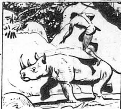
AS THE RHINO CHARGED A NEAR-NAKED WHITE MAN DROPPED UPON IT FROM THE TREES.

Як носоріг кинувся вперед, майже нагий чоловік упав на нього з дерева.