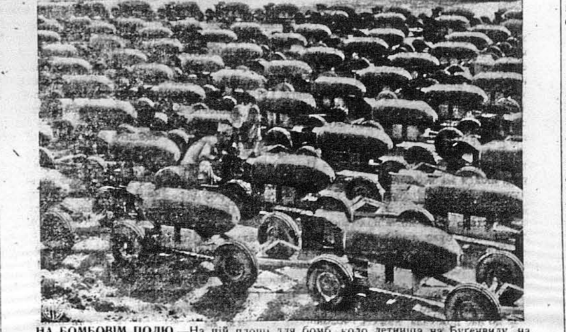
НА БОМБОВІМ ПОЛЮ. На цій площі для бомб, коло летнища на Бугецвилу, на Соломонах, збирається ті 2,000-фунтові бомби, оглядається й приготується до вантаження на літаки, що їх повезуть японцям у дарунок. Як показує світлина, бомби возять колісницями на гумових колах, а ці колісничі повязані одна з одною, аби кулі przypadково не зударилися зо собою.

ЛОНДОН. — Польський уряд у Лондоні подає, що він дістав з Польщі вістку, що в німецькнм концетраційнім таборі в Освенцімі, померла жінка генерала Міхайловича, начальника югославських чеників. Югославський уряд у Лондоні подав був свого часу, що німці арештували родину Міхайловича в квітні 1942 року.