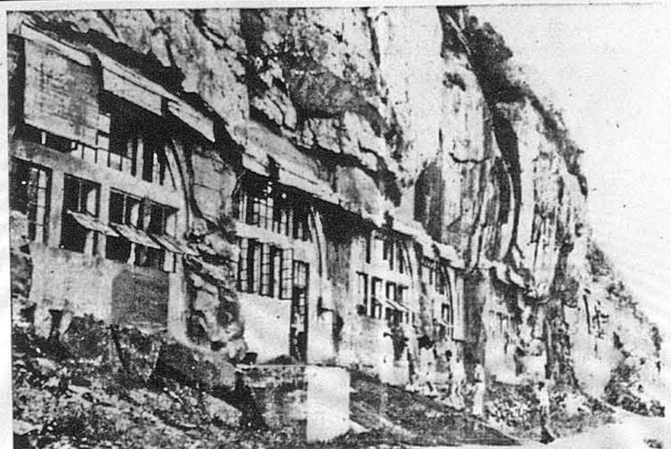
ФАБРИКА В ПЕЧЕРАХ. В одній місцевості в Китаю знаходиться в скалах глибокі печери. Іх переміною недавно на фабрики амуніції. Виробляється в них протиповзові гармати, важкі мотозрі, й гарматні кулі. Вони захоронені перед бомбардуваннями грубою скалою.