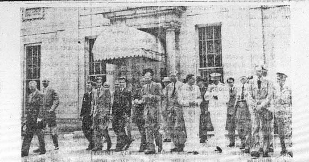
МИРОВА КОНФЕРЕНЦІЯ. Члени міждержавної конференції для забезпечення мира, що зібралася в Домбартон Овкс під Вашингтоном виходять з візитів в президента Рузвельта в Білому Домі. Президент заявив членам конференції, що як тільки німецька молодь, пересякнута нацистичними ідеями, буде мати якийсьбудь голос у світових справах, то нам усе буде грозити націзм. Конференція в Домбартон Овкс є по суті мировою конференцією; вона має на цілі вирішити одну з найважливіших справ мира.

ЛОНДОН. — Югославський уряд зірвав офіційно всякі звязки з генералом Міхайловичем, своїм недавнім міністром війни. Король Петро відобрав йому всякі уряди. З цєю заявою вся військова влада в Югославії знаходиться в руках маршала Тіта. Маршал Тіто, котрого й король і генерал Міхайлович колись, поборювали як комуніста, заявив, що тепер генерал Міхайлович уже не зможе скривати своєї зради за авторитет правного уряду.