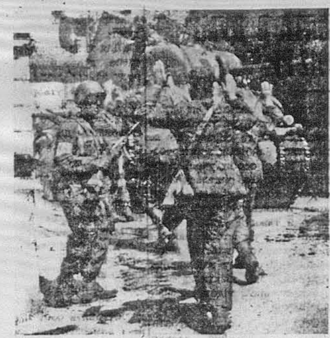
РУКИ ВГОРУ. Німецькі воїни в південній Франції піддаються американським піхотинцям, що ввійшли в місто з могутніми повззми. Німці не ставлять пова- жного опору й даються американцям гнати перед собою, долиною ріки Рони.

В КОЖНІЙ УКРАЇНСЬКІЙ ХАТІ ПОВИНЕН ЗНАХОДИТИСЯ ЧАСОВИК „СВОБОДА“