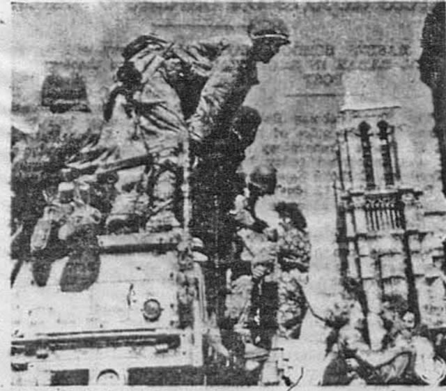
ВЕСЕЛИЯ ПАРИЖ. Алянським військам справлено при відї до Парижа голосне прийяття. Французжанкі танцювали на вулицях з американськими войками, а денкі з них всїдали до американських повзїв. На задньому тлі світліни одна вежа катедри Нотр Дам.

NATIONAL CLEANING CO. 9 W. 29 St. (nr. 5 Ave.) N. Y. C.