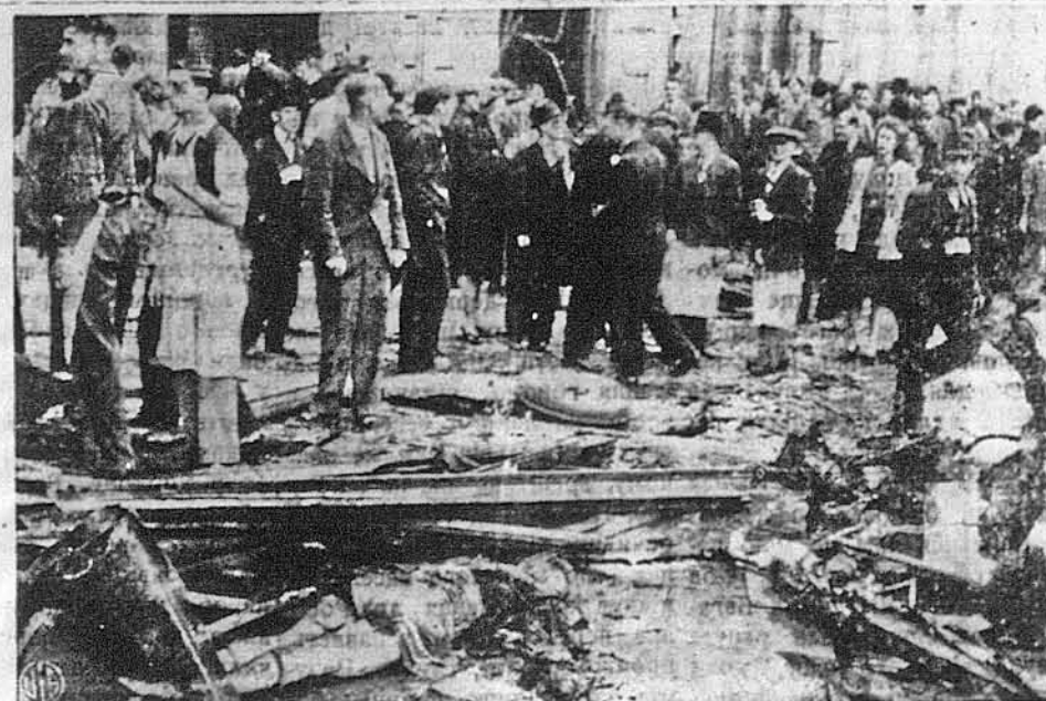
ЩО ЛИШАЮТЬ ЗА СОБОЮ БОМБИ-РОБОТИ? — Надходять вісти про нові замаганія нацистів тероризувати Англію новими бомбами-роботами. Не знати ще, чи це пропаганда, чи правда. Та правдою є велике знищення, яке спричинили давні бомби-роботи. Доперва тепер дозволяють помішувати трагічні сцени такого німецького терору. На образку бачимо сцену, зняту десь в Полудневій Англії зараз по бомбардуванню. Труп одної жінки перед нашими очима, а другий під румовищами.