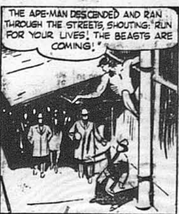
Тарзан зішов з дому і побіг вулицями, кричучи: „Рятуйте життя втече! Звірі йдуть!“.