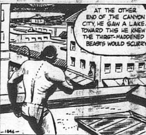
На другому кінці міста він побачив озеро, до котрого певно підуть спрагнені звірі.