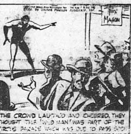
Юрба сміялася й кпіла. Вони думали, що це „дикий чоловік“ заповідає циркову параду.