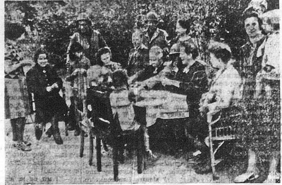
АМЕРИКАНЦІ ГОДУЮТЬ ГОЛОДНИХ НІМЦІВ. — На образку бачимо перебуваю на селу: американський вояк роздає поживу населенню одного малого німецького села, до якого ввійшли американські вояки. Це в заплату за те, що населення повитало Альянтів як визвольників.

Підчас утечі з Румунії застрілено д-ра Артура Тестера, ірландця, котрий у 1939 році поїхав до Німеччини й там добився такого впливу серед нацистів, що полорожував з паспортном, підписаним власноручно Гітлером.